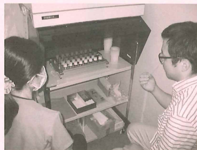
実際の検査の様子

嗅覚障害はQOLに多大な影響を及ぼし、嗅覚障害者の約40%が日常生活に不満を抱いているとされています。その内容には調理や食生活に関わる障害の訴えが多く、飲食が楽しめなくなるなど、QOLに大きく影響を与えてしまいます。異嗅症を伴っている慢性副鼻腔炎患者ではうつ傾向が強いことなども報告されています。ただでさえ外出、会食制限やマスク着用など、徐々に緩和して来ているとはいえ、憂鬱な気分になりがちな状態が続いています。嗅覚の症状でお困りの方は是非一度耳鼻咽喉科を受診していただき、ご相談いただければと思います。